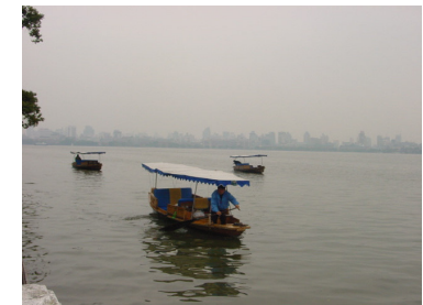
West Lake in China